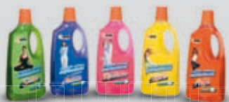
Limpiador multiusos antibacterial