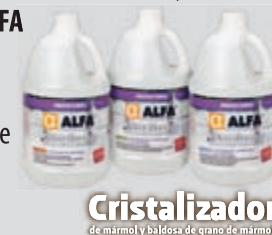
Cristalizador de mármol y baldosa de grano de mármol

para dar un acabado brillante más duradero y mayor protección, pregunte por nuestro SERVICIO DE CRISTALIZACIÓN ALFA .