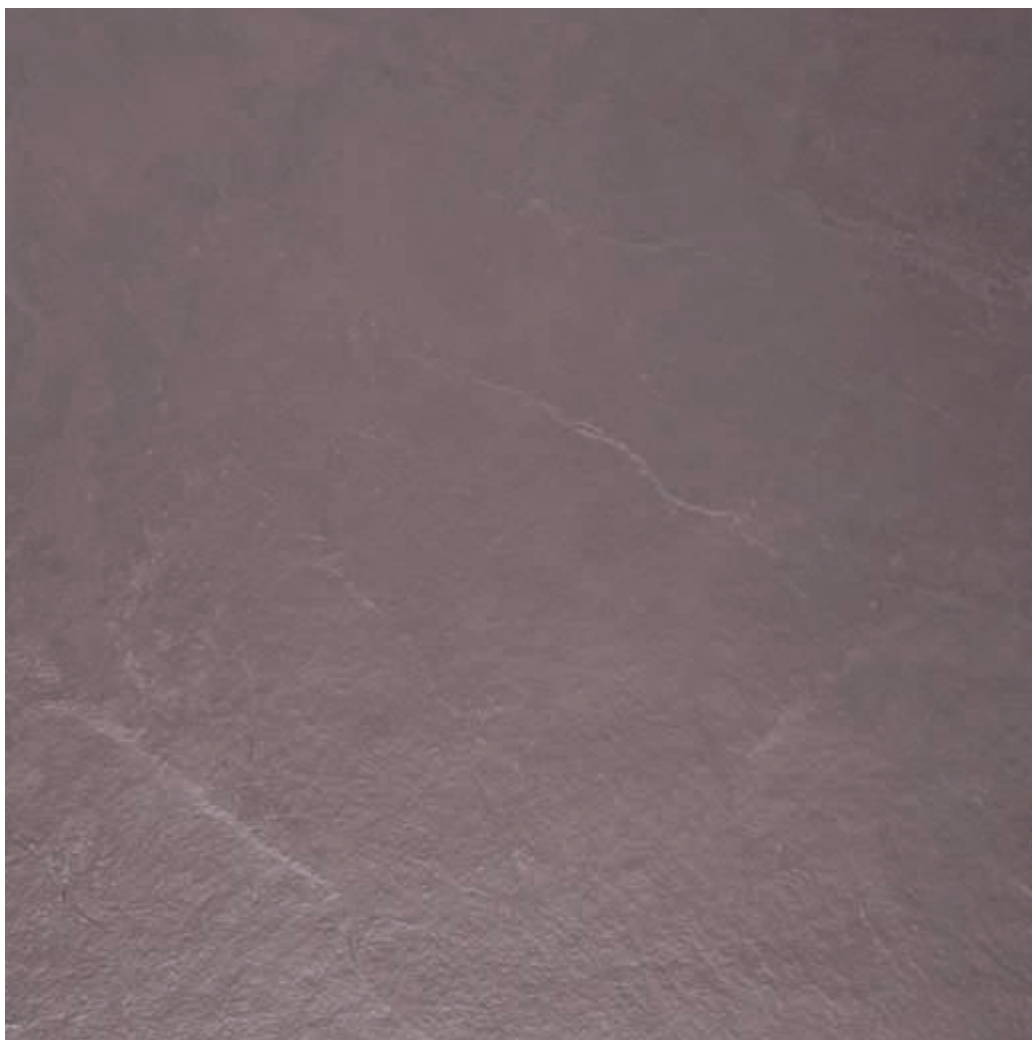
Muestra: Pizarra Natural Vinotinto