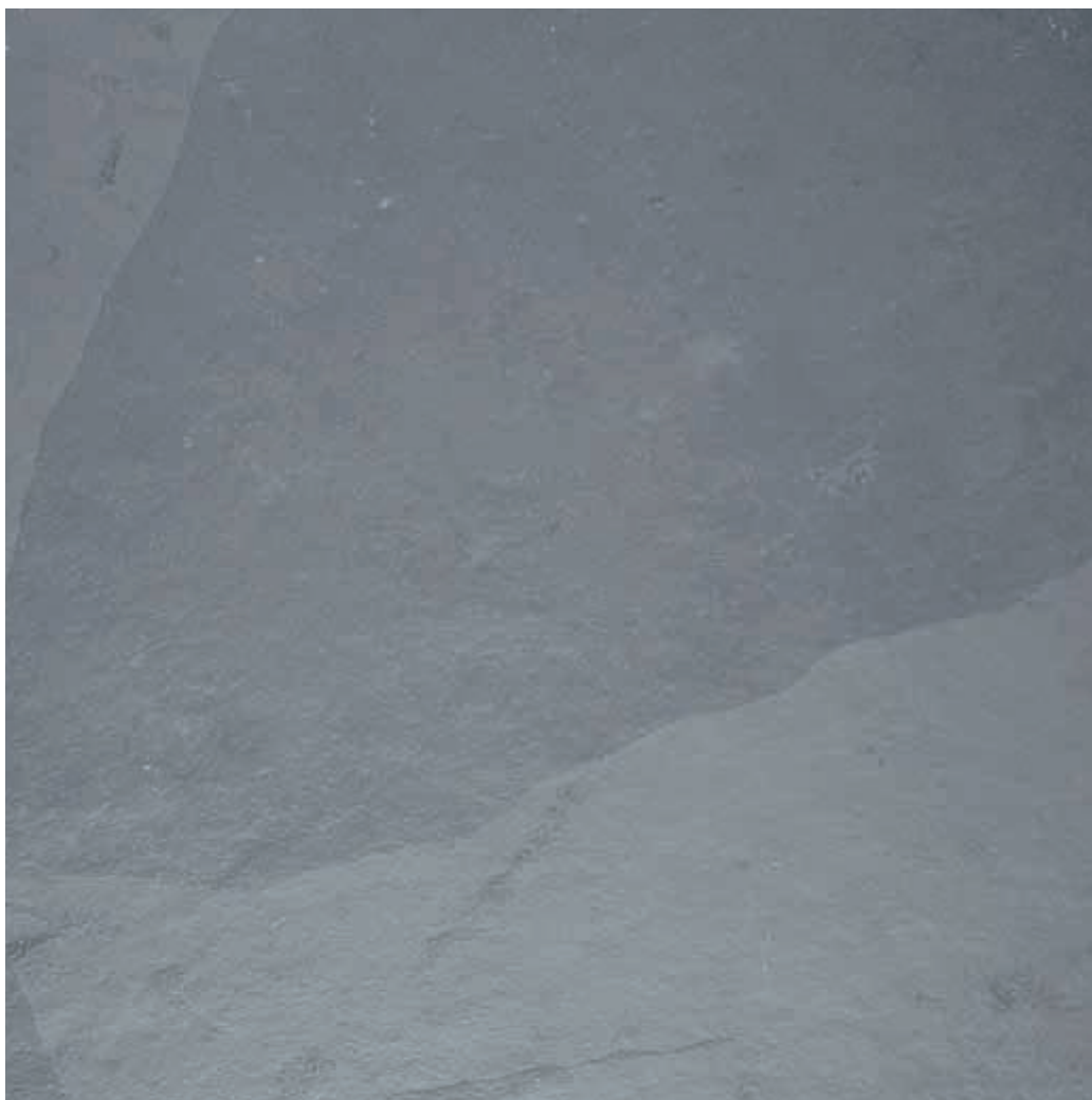
Muestra: Pizarra Natural Ceniza (gris)