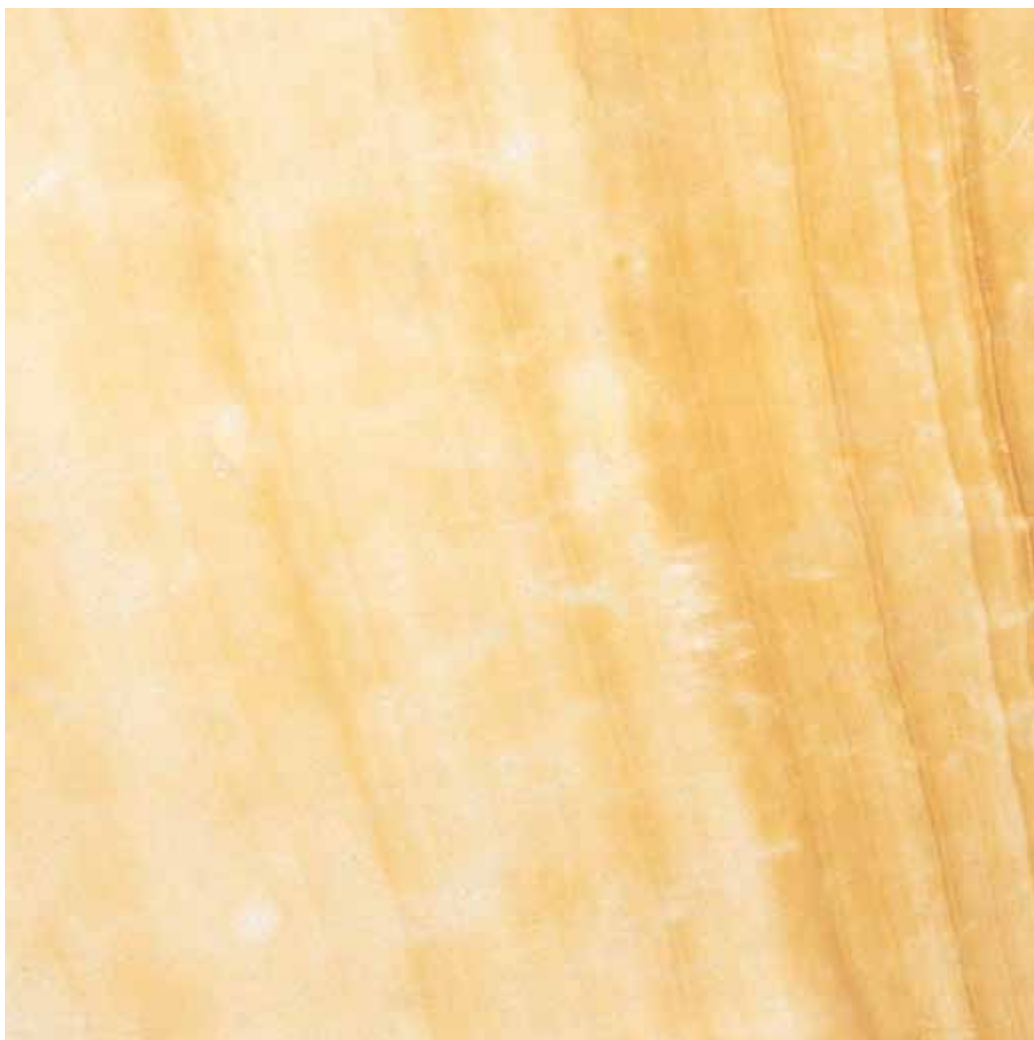
Muestra: Piedra Muñeca Amarilla