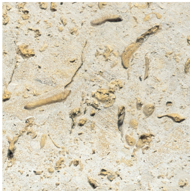
Detalle Variación 2

Las tonalidades de las fotos son indicativas y no constituyen una reproducción exacta del producto