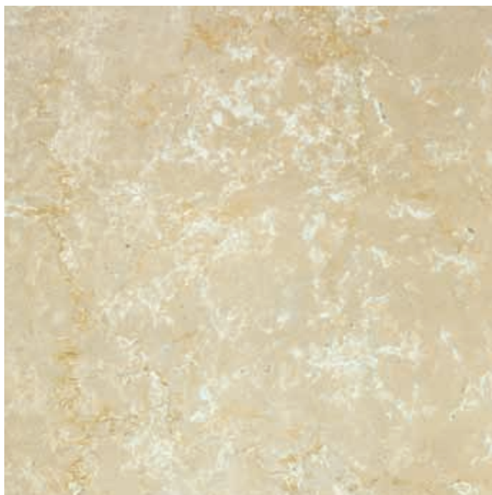
Muestra: Mármol Botticino Tono 3b

Las tonalidades de las fotos son indicativas y no constituyen una reproducción exacta del producto