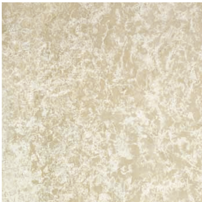
Muestra: Mármol Botticino Tono 3b