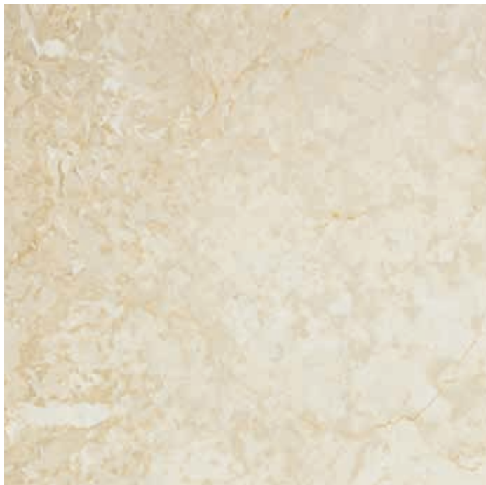
Muestra: Mármol Botticino Tono 3b