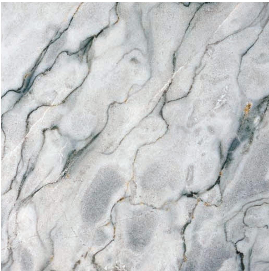
Muestra: Mármol Gris Payandé