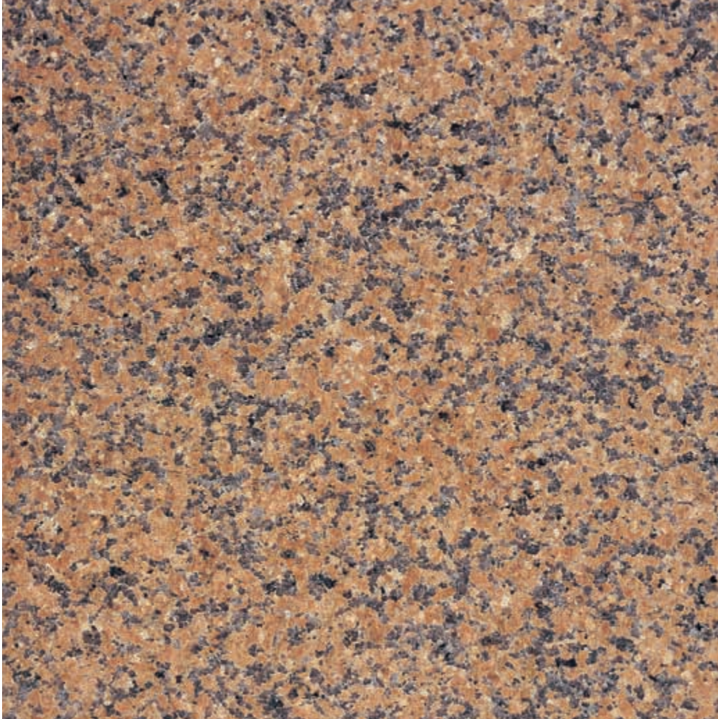
Muestra: Granito Rojo Sierra