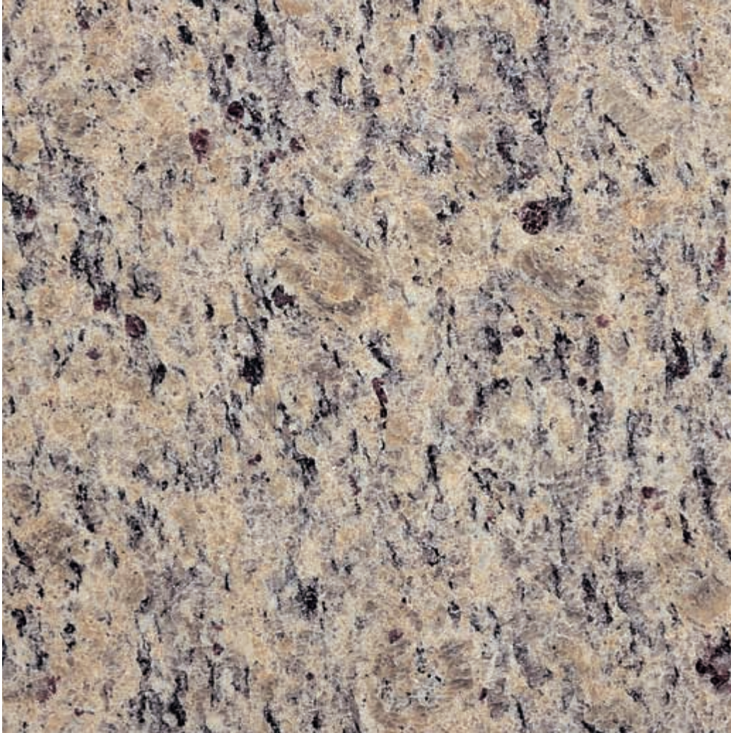
Muestra: Granito Crema Imperial