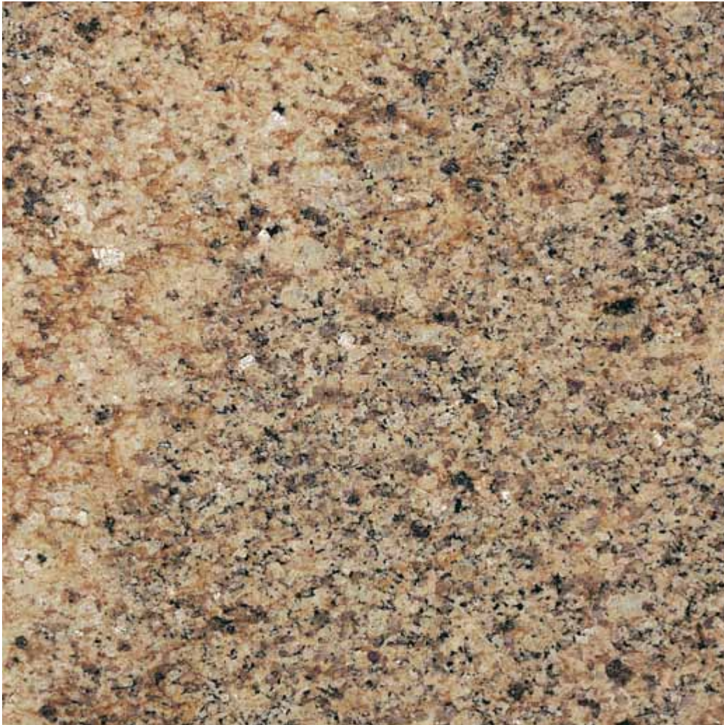
Muestra: Granito Amarelo Humaita