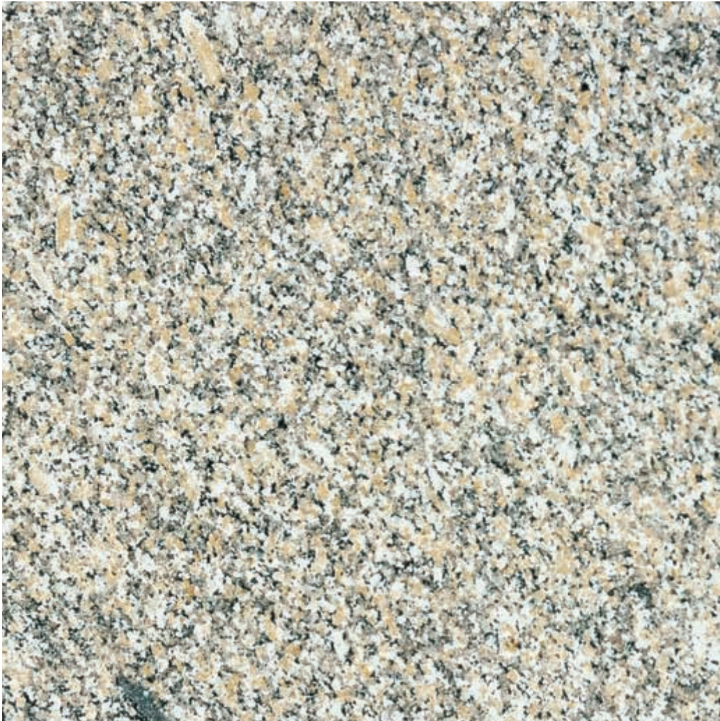
Muestra: Granito Rosa Beta