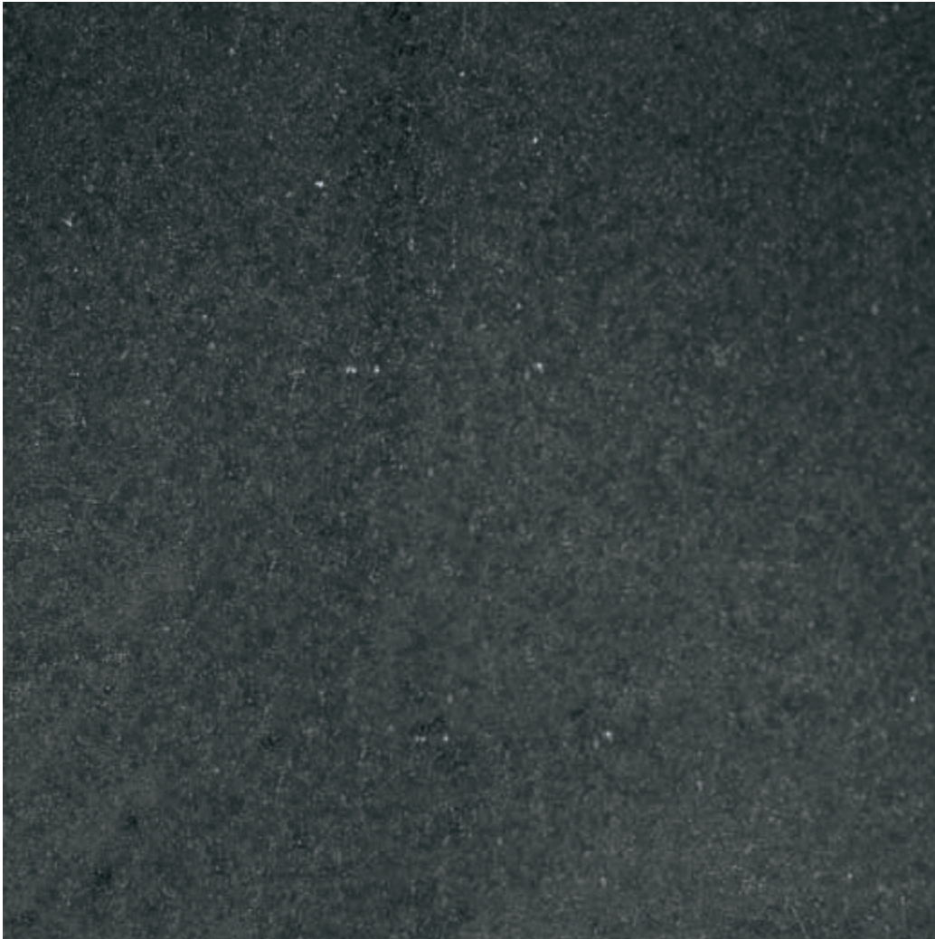
Muestra: Granito Negro Preto