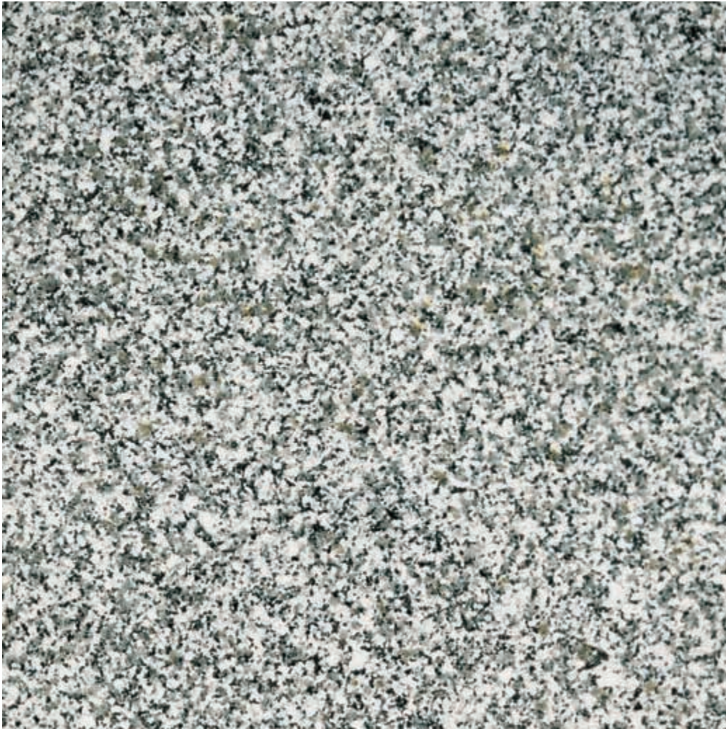
Muestra: Granito Jaspe